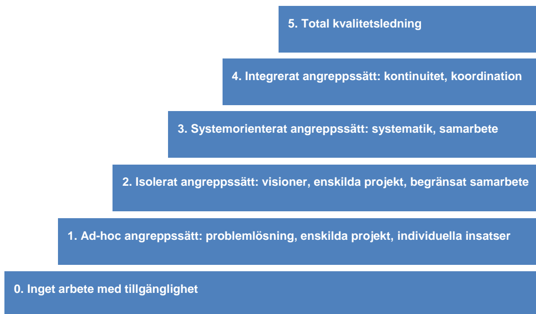
Figur 2. Utvecklingstrappan

ISEMOA:s tillgänglighetsrevision är inte normativ. Den kräver att kommunen tar en aktiv roll i att undersöka och utvärdera sitt nuvarande tillgänglighetsarbete med hänsyn tagen till de 16 element som presenterades i avsnittet ovan, för att sedan bestämma sig för hur förändringar i en del av dessa element ytterligare skulle kunna förbättra arbetet. För att bedöma kommunens tillgänglighetsarbete inom vart och ett av dessa 16 element används en utvecklingstrappa för att tydliggöra en kommuns utvecklingsstadium. Sex utvecklingsstadium finns, se Figur 2.